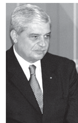
Ministro Miguel Jorge