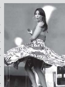
Ivete Sangalo e cotada para

que grandes banqueiros do mundo estarão presentes no evento, que tem na comissão organizadora o jornalista e produtor baiano Carlos Borges, que reside nos Estados Unidos. O nome sugerido para comandar a comemoração dos banqueiros é o da cantora Ivete Sangalo, cujo cachê chega à casa dos R$400 mil. A organização do evento está verificando a disponibilidade de data resultados devem ser utilizados em prol do povo brasileiro, jamais em festas nababescas. Num momento em que a ética com a coisa pública é o foco da mídia, esta festa será um desastre para a imagem do banco frente a opinião pública. Pra piorar, estes gastos são planejados no mesmo momento em que o banco se nega em negociar com seus funcionários questões importantes como o pagamento das substituições. É revoltante!"