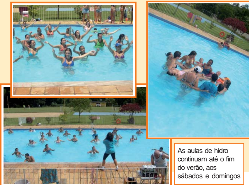
As aulas de hidro continuam até o fim do verão, aos sábados e domingos

A hidroginástica vai continuar até o fim do verão (exceto em dias chuvosos), sempre aos sábados e domingos de manhã e à tarde. Não haverá cobrança de taxa adicional. O valor da portaria para convidados é de R$10,00