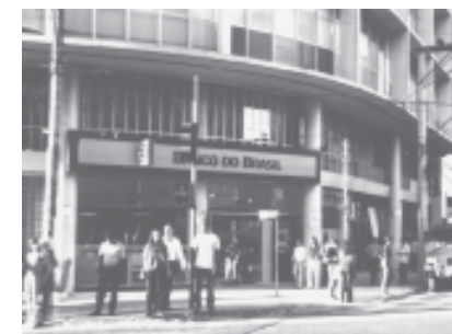
funcionalismo do BB espera respostas