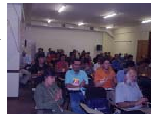
Os bancários acompanharam interessados as deliberações da Conferência